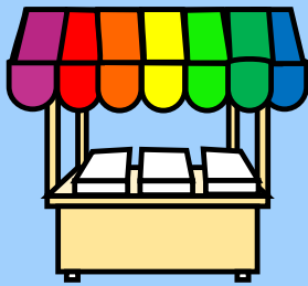
サンドウィッチ&カフェ PEER