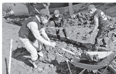
庭の泥かき作業などを行う