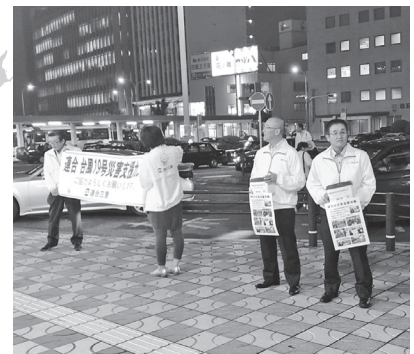
街頭で災害救援カンパを訴える