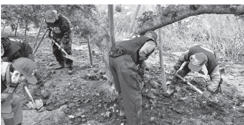
りんご園で樹木の根元の泥かき作業は重労働