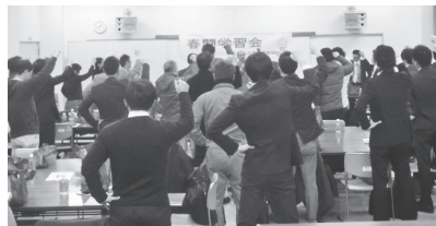
▲春闘団結ガンパロー(三泗地協春闘学習会)