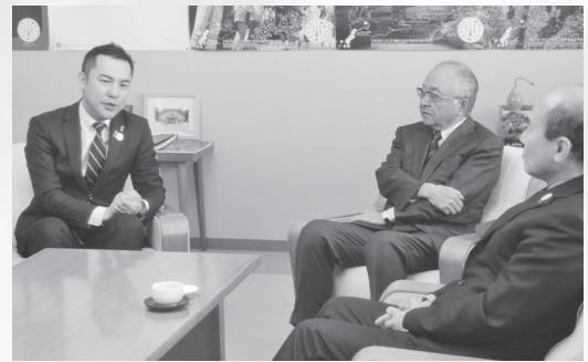
▲2.6三重県知事と連合本部古賀会長、土森会長との懇談会