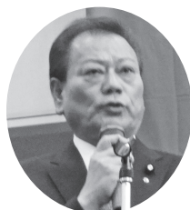
芝 博一参議院議員