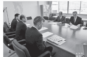
▲2.16三重県商工会議所連合会へ要請