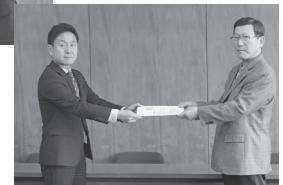
▲3.9熊野商工会議所へ要請