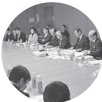
▲2.10三重県経営者協会へ要請