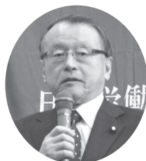
中川 正春衆議院議員