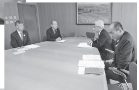
▲2.13三重県中小企業団体中央会へ要請