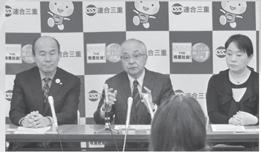
▲2.6記者会見(連合本部古賀会長・中央)

連合三重においても、政策制度の実現をめざし、雇用の維持・拡大、雇用の安定と公正労働条件の確保、ワークライフバランスの推進、均等待遇による「ディーセントワーク(働きがいのある人間らしい仕事)」の実現を中心に、行政機関や、各種団体に要請行動などを行いました。