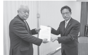
▲3.4亀山商工会議所へ要請