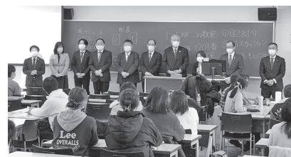
▲自己紹介する連合三重役員

連合三重では引き続き、労働組合の意義や活動について知っていただける機会の充実をめざして取り組みを進めていきます。