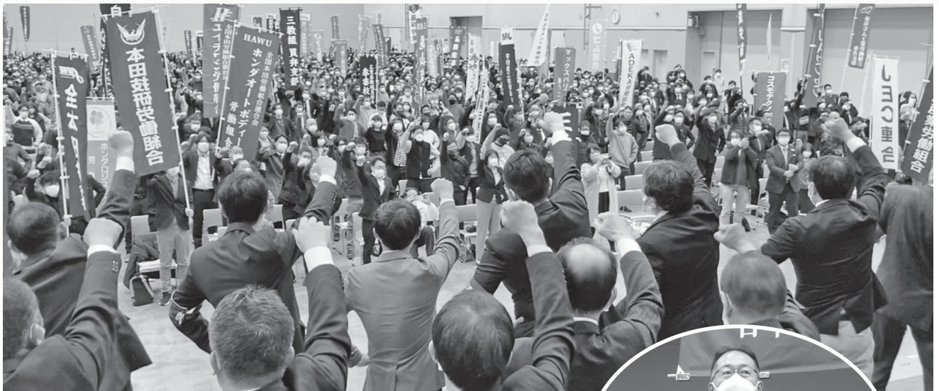
▲2023春季生活闘争三重県総決起集会