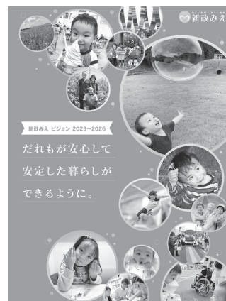
▲新政みえビジョン2023～2026