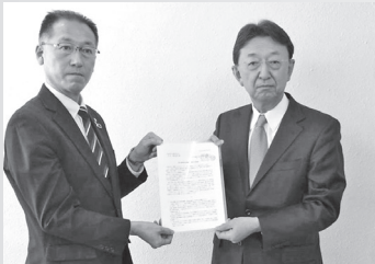
▲三重県商会議所連合会(2月9日)