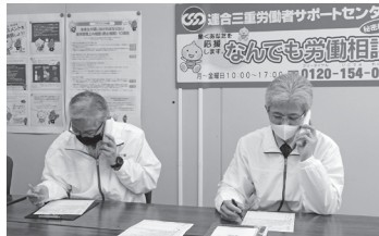
▲「全国一斉集中労働相談ホットライン」の開設(2月21日～22日)