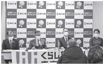
▲2023春闘記者会見(1月30日)