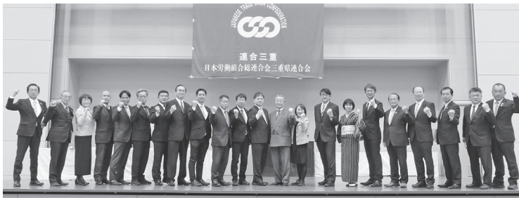
▲第20回統一地方選挙勝利三重県総決起集会