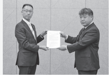
▲三重県経営者協会(2月24日)