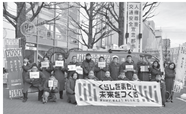
▲連合緊急アクションin三重(2月1日～2日)

三重県では、2023年2月1日～2日にかけて、「賃上げ」「格差是正」「子育て支援」などを訴えながら県内を走行し、最終日には近鉄四日市駅前前で街宣活動を行いました。街宣には、連合三重、三泗地協役員他、連合三重推薦議員の皆さまにもご参加いただき、賃上げをはじめとする「人への投資」の重要性を力強く訴えかけました。