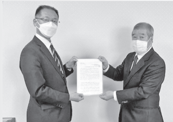
▲三重県商工会連合会(2月6日)