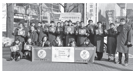
▲近鉄四日市駅前街宣行動

3月8日は国際女性デーです。今年の3.8国際女性デー全国統一行動のテーマ“今こそChange, Challenge, Movement!～社会のすべての仕組みにジェンダーの視点を～”を合言葉に、連合三重は各地協において、3月8日を中心に駅前街宣や音源流しによるアピール行動を行いました。