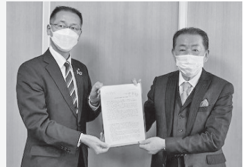
▲三重県中小企業団体中央会(2月6日)