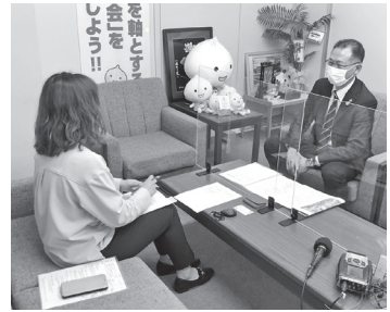
▲FM三重生出演(写真は昨年)