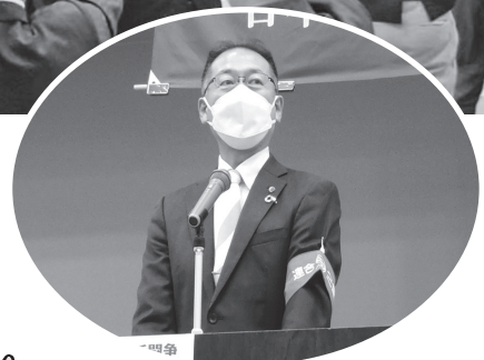
▲主催者挨拶をする番条会長