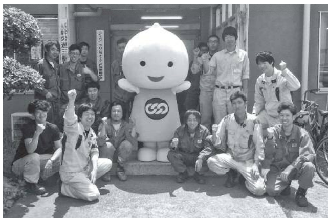
▲青年部の「ユニコラボつ」のみなさん

職場での悩みや問題解決のための「職場進出」をはじめ、他職場の組合員やその家族と触れ合えるイベントなども開催しているユニ。