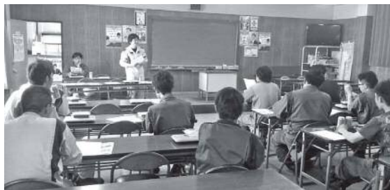
▲昼休みを活用して会議を開催します