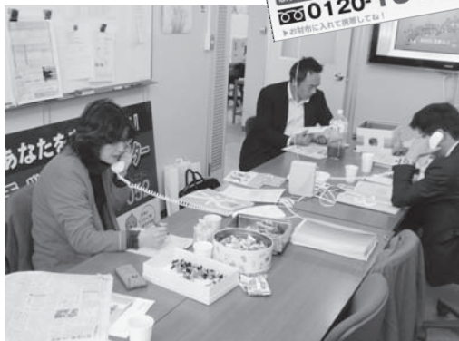
2011全国一斉「労働相談」