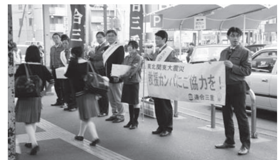
2011災害救援カンパ活動