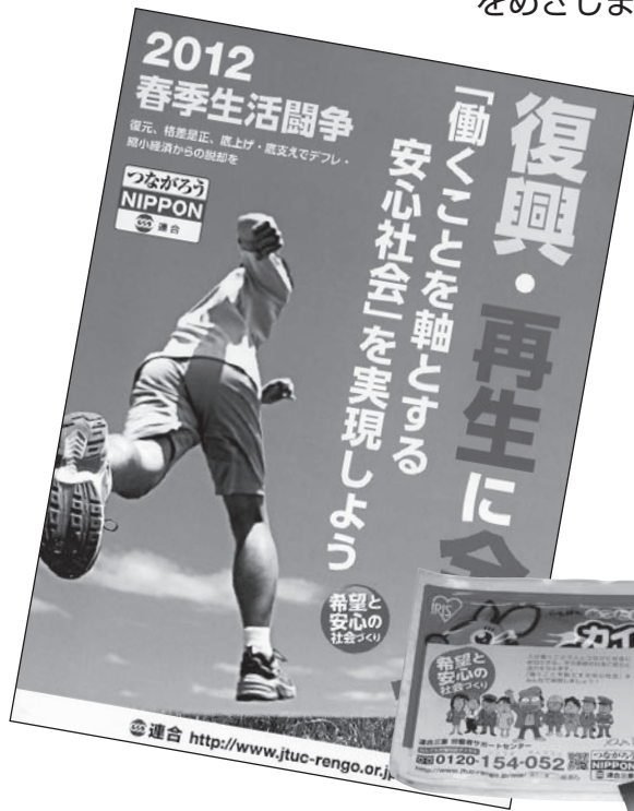
街頭行動では、カイロやティッシュを配布しアピール