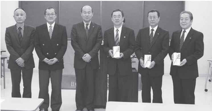
土森会長(中央)と各首長と紀南地協議長、南熊労福協会長

連合三重と三重県労福協で取り組みを行った「台風12号災害に伴うカンパ・義援金」は、12月末現在で連合本部愛のカンパ・連合三重・構成組織・地協・地方連合会・三重県労福協などから13,569,174円を集約しました。